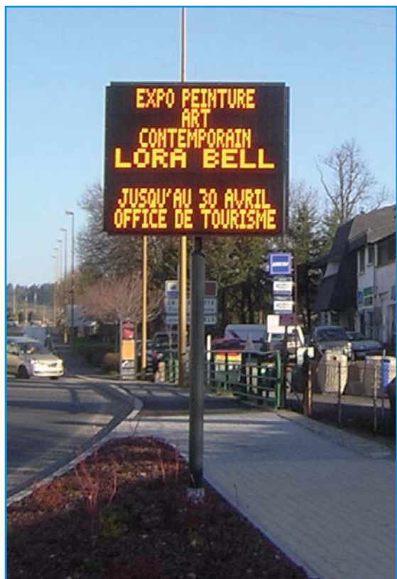
Affichage d'informations culturelles