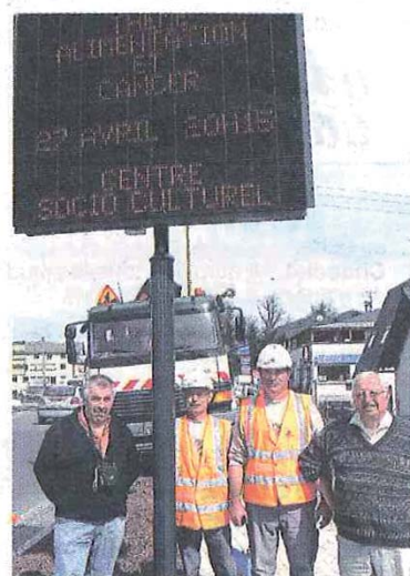
Article paru dans La Lozère Nouvelle du 30 avril 2010

Une installation qui a été effectuée par les techniciens de l'Entreprise Mic Signaloc basée à Cournon-d'Auvergne (Puy-de-Dôme).