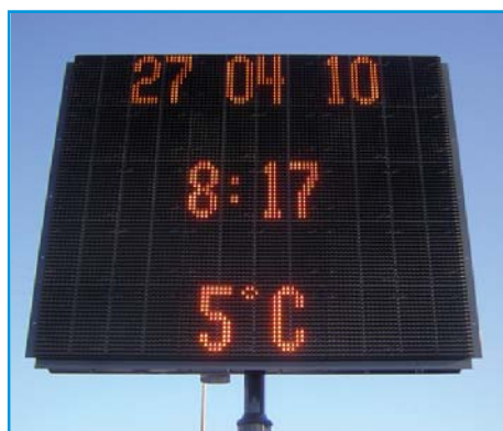
Affichage de la température