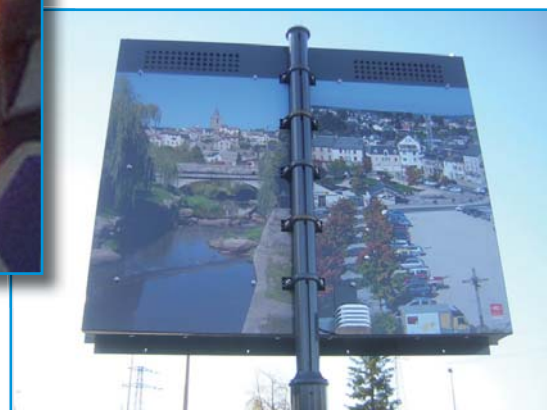
Habillage du dos par un décor en impression numérique